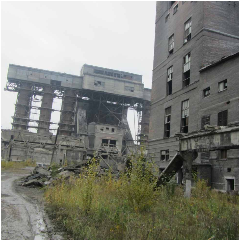
Химпром. Усолье-Сибирское Иркутской области