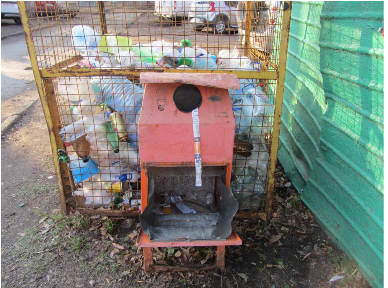
Экобокс для ртутьсодержащих отходов в Советском районе Уфы