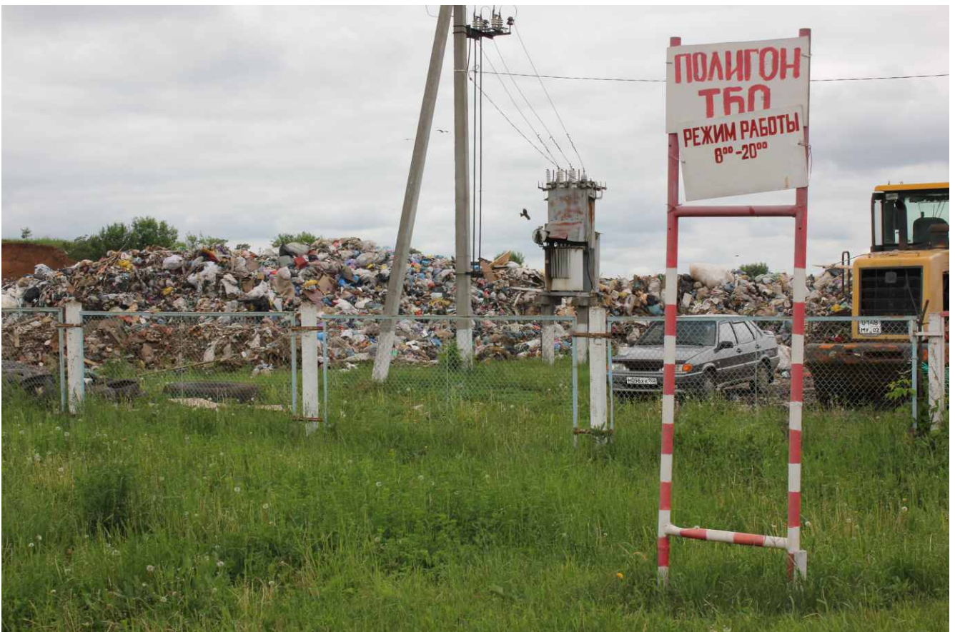
Свалка ТКО ООО «ТАБИГАТ» в г. Бирске