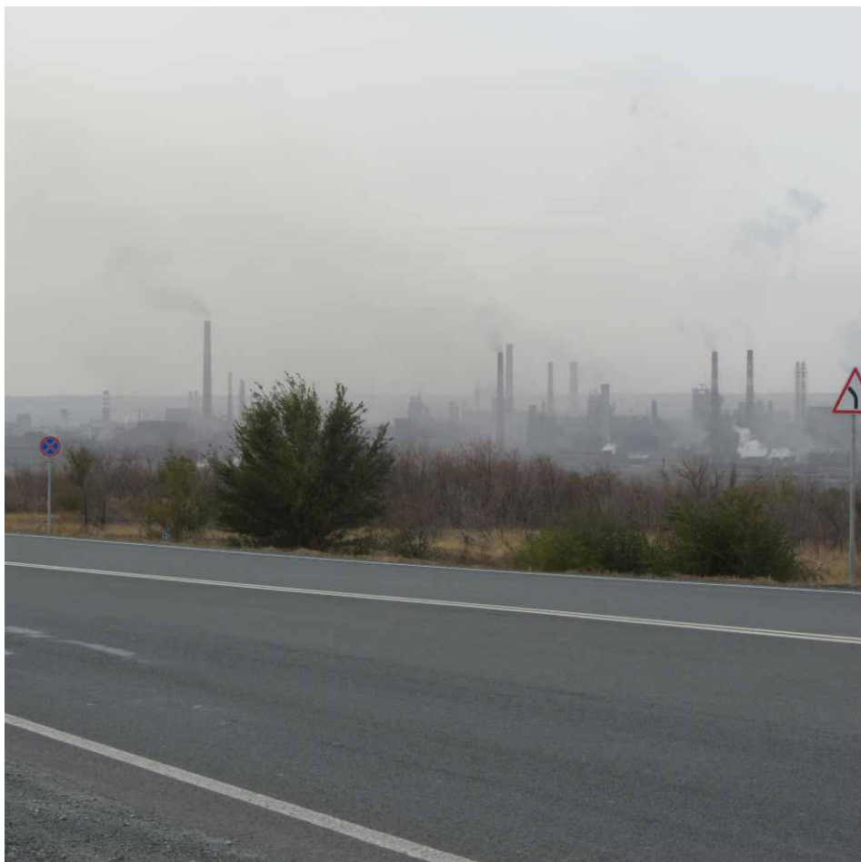
Смог в г. Новотроицке Оренбургской области