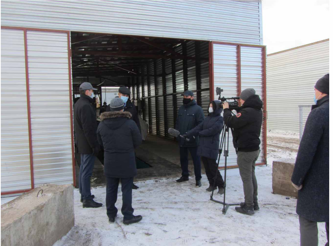
Открытие МСК ООО «НОВЭТ» с. Кушнареново